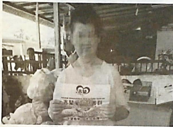
MANGSA tinggal bersama suspek sejak 12 tahun lalu.

punyai tiga orang iaitu dua lelaki dan seorang perempuan manakala suspek merupakan anak sulung mangsa.