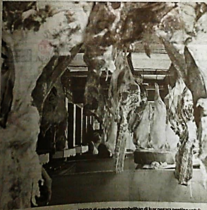
PEMASANGAN kamera litar tertutup (CCTV) di rumah penyembelihan di luar negara penting untuk memantau aktiviti penyembelihan agar tidak melanggar syarat yang ditetapkan Jabatan Kemajuan Islam Malaysia (Jakim).